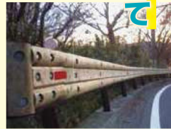
木製ガードレール設置例

森林環境税が注目を集める中、「かながわ木づかい運動」等で得たノウハウを、市町村と共有していただきたい。