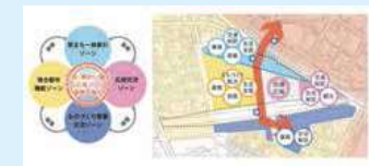
相模原市ホームページ 「相模原市リニア駅周辺まちづくりガイドライン」より抜粋

県では11月1日、相模原市とJR東海の3者で「さがみロボット産業特区に係る連携と協力に関する協定」を締結し、相模原市との間で一定の協力関係はできているとは承知している。また、JR東海がリニア中央新幹線神奈川駅の開業を見据えて、来春の開業を目指すR&D拠点は、今後のさがみロボット産業特区のさらなる発展のカギになることが考えられ、相模原市との連携のもと、この拠点を活用して様々な取組を推進していく必要がある。今後、リニア中央新幹線神奈川駅の開業に向けて、相模原市及びJR東海と連携し、さがみロボット産業特区の活性化を図るため、どのような取組を行っていくと考えているのか、見解を伺う。